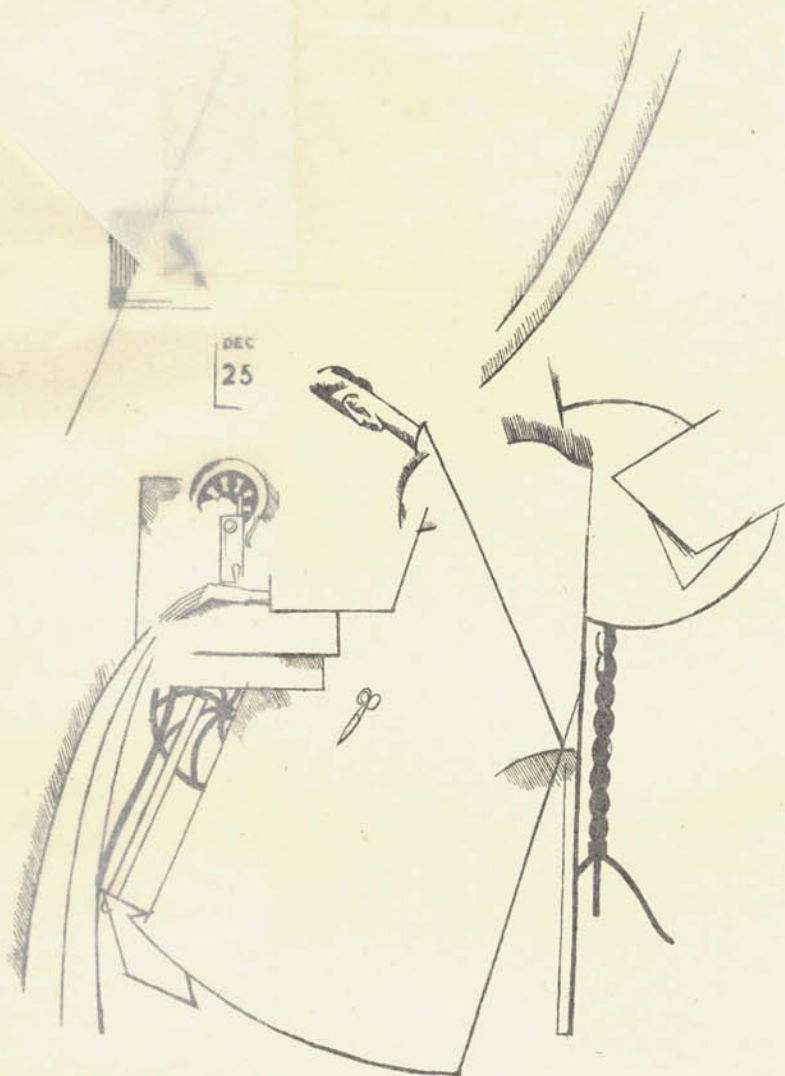
Dessin de Lloyd.